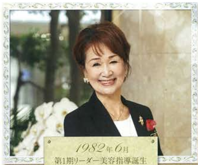
1982年6月 第1期リーダー美容指導誕生

創業者の右腕として何ごとも率先垂範し、美容指導のお手本になる。1982年、第1期リーダー美容指導に認定された私たちには、そうした使命がありました。アイビーの理念に基づき、肌と心の美しさをお届けするには、自分の人生と真剣に向き合い、生き方を磨きあげる必要があります。高い美意識をもち、常に最高の自分を追い求めることもまた、お客様に対する責任なのです。美しい生き方を自ら実践することは、目の前の人に「私もアイビーを伝えたい」と思っていたいくともつながります。自分の姿を通して、仲間が増えていく喜びこそが、今も変わらない私の原点かもしれません。