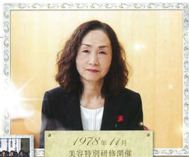
1978年11月 美容特別研修開催