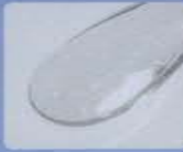
スパチュラの先端。ラメが輝いています。

すべての人と調和する新たな起源として、広がり続ける宇宙をイメージしたアイビーコスモス。細胞分裂からインスパイアされたキャップや、美しいラメが入り夜空を感じさせるアイビーコスモスWエマルジョン クリームならではのスパチュラなど、デザインにも注目を。